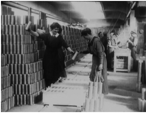
Verpacken von Geschossen in Fabrik Poldihütte