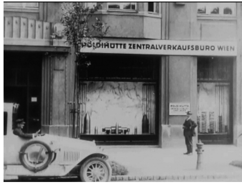
Brotlaibe-Geschoße in Fabrik Poldihütte