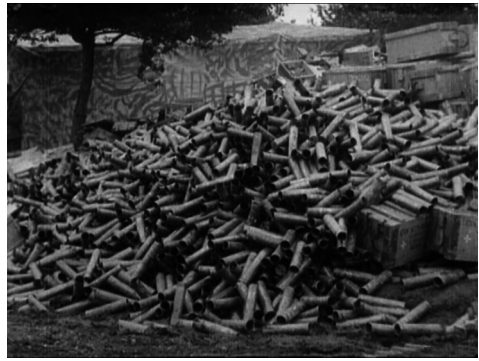
„Ausgepackte“ Geschosse in The Battle of the Somme

niert dagegen eine andere Wirtschaftslogik: die der industriellen Massenproduktion, die in Kriegsgütern ein ideales, weil schnell wieder „verbrauchtes“ Erzeugnis gefunden hat.