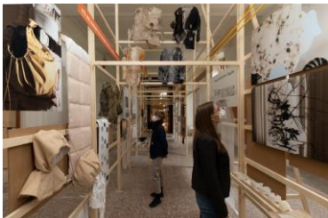
HITZE TAKES COMMAND, Institut für Kunst und Architektur (IKA), Installationsansicht in Atelierräume der Akademie der bildenden Künste Wien am Schillerplatz