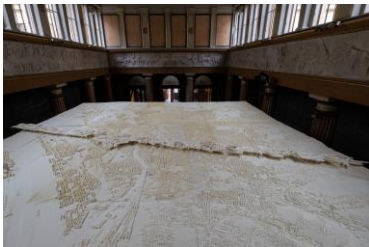
HITZE TAKES COMMAND, Institut für Kunst und Architektur (IKA), Installationsansicht Aula der Akademie der bildenden Künste Wien am Schillerplatz (Blick von oben)