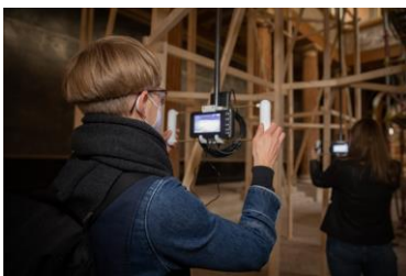
HITZE TAKES COMMAND, Institut für Kunst und Architektur (IKA), Installationsansicht Aula der Akademie der bildenden Künste Wien am Schillerplatz, Foto: © eSeL.at - Lorenz Seidler (Blick auf das Modell durch Periskope)