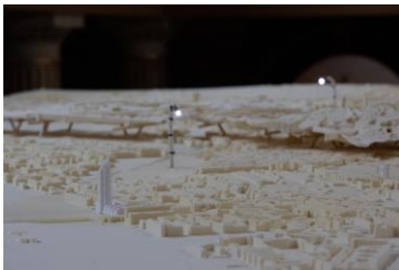
HITZE TAKES COMMAND, Institut für Kunst und Architektur (IKA), Installationsansicht Aula der Akademie der bildenden Künste Wien am Schillerplatz, Foto: © eSeL.at - Lorenz Seidler (Modell mit Periskopen)