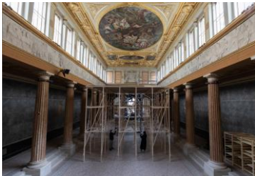
HITZE TAKES COMMAND, Institut für Kunst und Architektur (IKA), Installationsansicht Aula der Akademie der bildenden Künste Wien am Schillerplatz