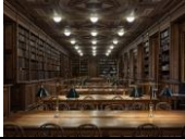
Akademiegebäude am Schillerplatz Bibliothek