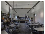
Akademiegebäude am Schillerplatz Mensa