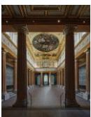
Akademiegebäude am Schillerplatz Aula © Helmut Wimmer