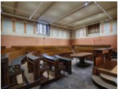
Akademiegebäude am Schillerplatz Anatomiesaal