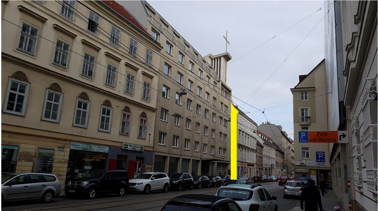
Bild 3: Fassade Ungargasse (in Gelb) / Fig. 3: facade Ungargasse (in yellow)