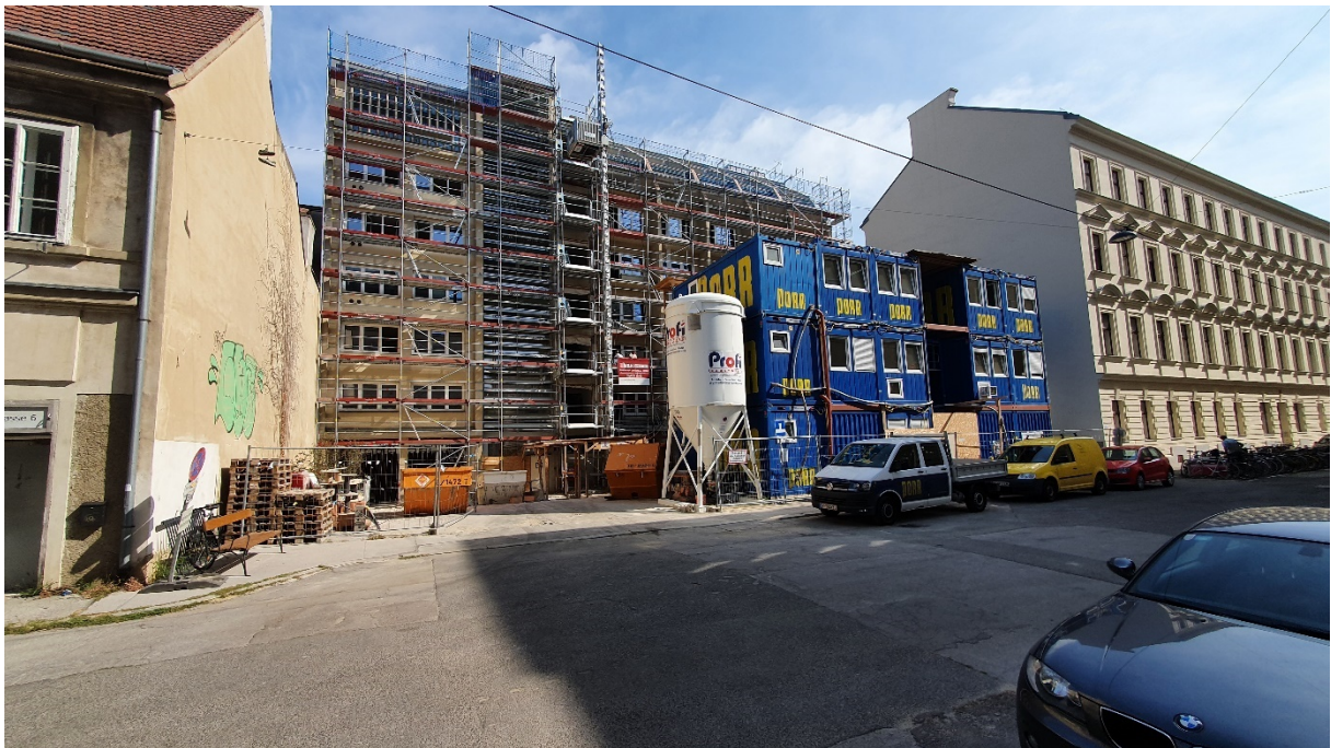
Bild 2: Fassade Krummgasse / Fig. 2: facade Krummgasse